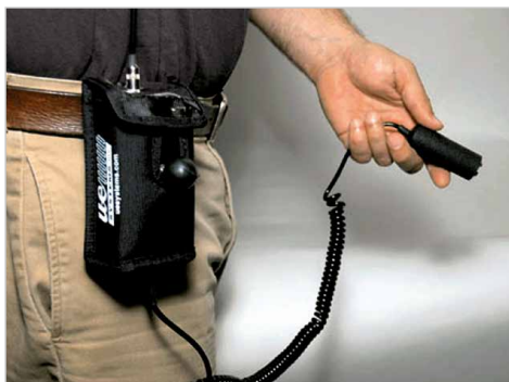
Tasche für UP 201