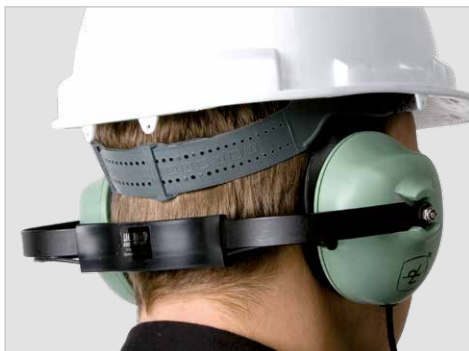
Kopfhörer zur Verwendung mit Schutzhelmen