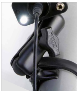
Befestigungs-Kit im Lieferumfang enthalten