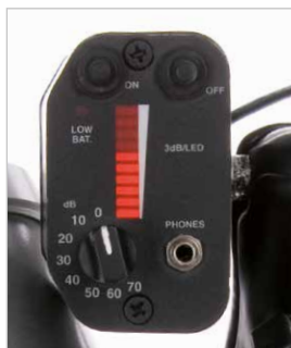
LED-Display und Empfindlichkeitsregler