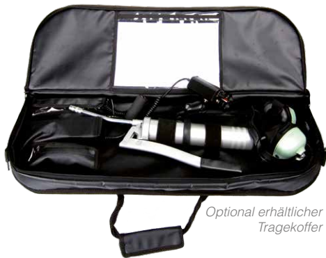
Optional erhältlicher Tragekoffer